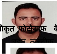
अस्वीकृत फोटोग्राफ के नमूने